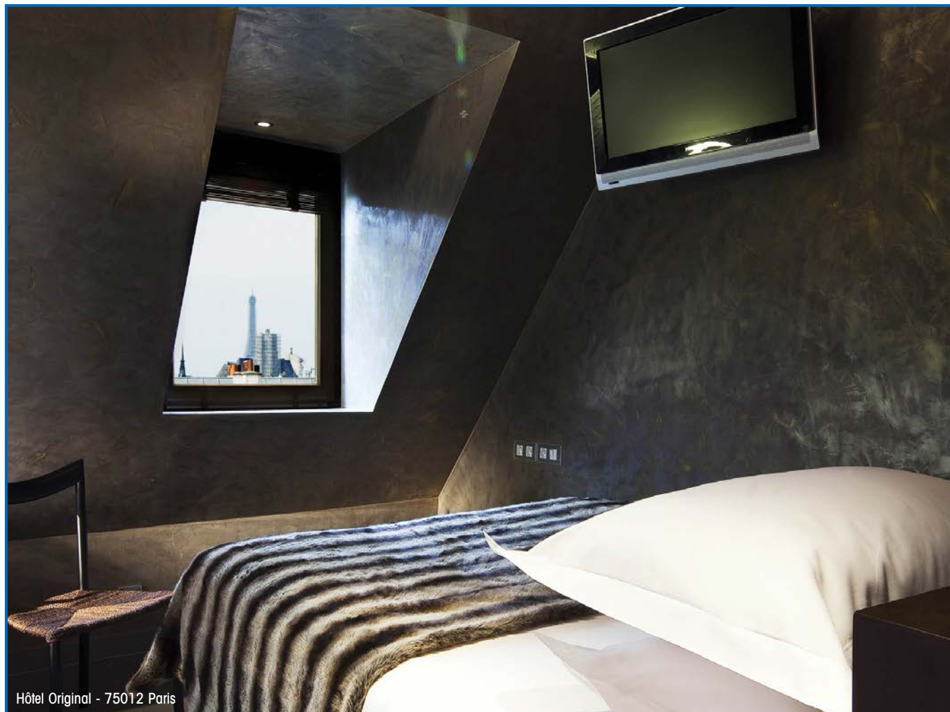
Hôtel Original - 75012 Paris

«La présente notice a pour but d'informer notre clientèle sur les propriétés de notre produit. Les renseignements qui y figurent sont fondés sur nos connaissances actuelles et le résultat d'essais effectués avec un constant souci d'objectivité, en fonction de conditions d'utilisation conformes aux normes ou DTU en vigueur». L'évolution de la technique étant permanente, il appartient à notre clientèle, avant toute mise en œuvre, de vérifier auprès de nos services que la présente notice n'a pas été modifiée par une édition plus récente.