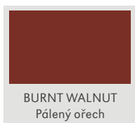
BURNT WALNUT Pálený ořech